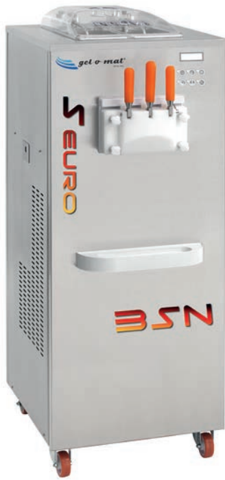
SUPER EURO 3SN