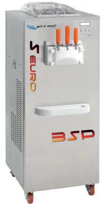
SUPER EURO 3SP