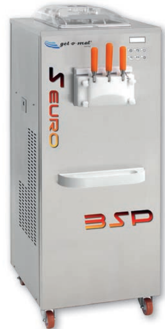
SUPER EURO 3SP

Abmessungen (BxTxH): 590 x 640 (+90) x 1420 mm Kühlung: Luftkühlung (Wasser auf Anfrage)